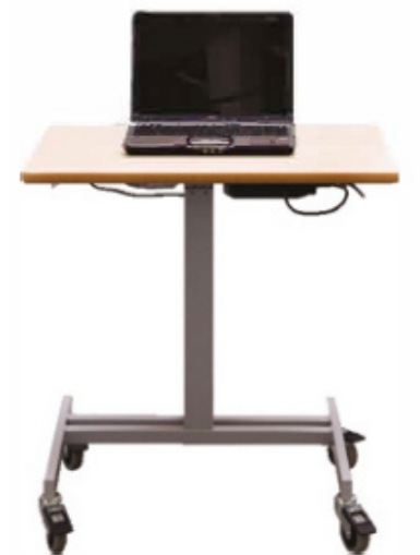
Mobila HS med topplatta i bokfanér