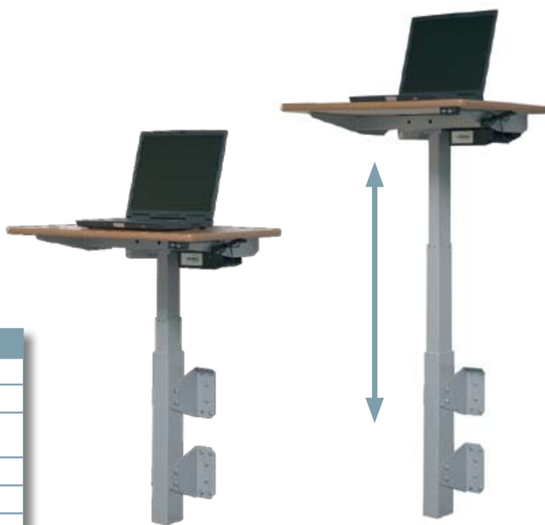
HS bordet nedsänkt läge

Bordet finns i flera olika utföranden, med topplatta i bokfanér eller vit laminat, i måtten 70x50 cm, 60x60 cm, 80x60 cm samt 100x60 cm. Stativen monteras med enkelhet på vägg och har lyftkapacitet på 65 resp. 120 kg.