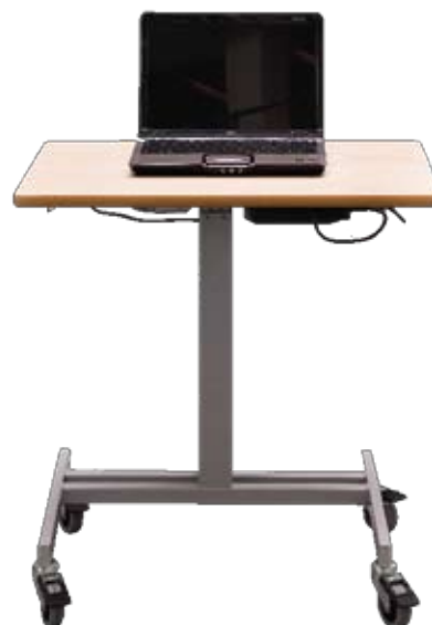
Mobila HS med topplatta i bokfanér